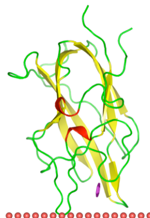
Dominio activo de un factor de la coagulación